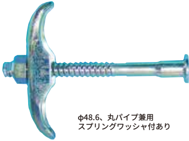
φ48.6、丸パイプ兼用 スプリングワッシャ付あり