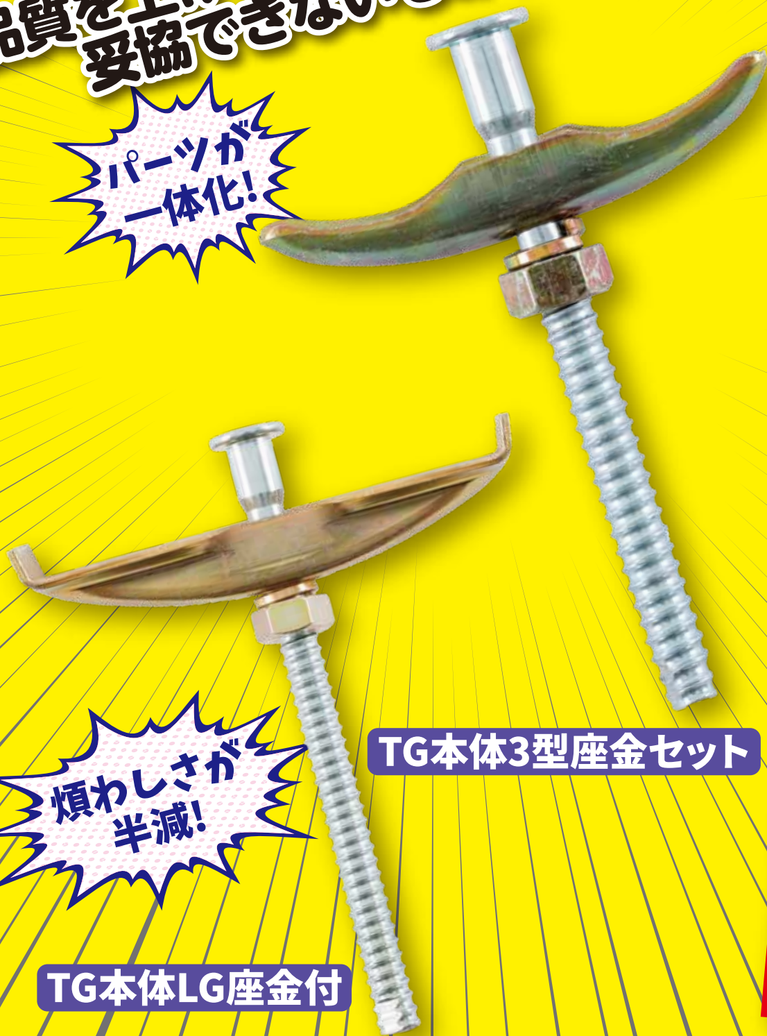
TG本体3型座金セット